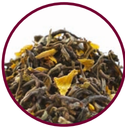
Nr. 930 Ostertee / Frühlingserwachen

«Sehr lecker, macht gute Laune... :) Schon weiter empfohlen an Kollegen und Familie.» (Bewertung vom 28.04.16)