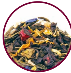
Nr. 1621 Midsommar

«Sehr frischer und leckerer Tee. Die Würzigkeit und Blumigkeit treten hier besonders hervor. Sehr zu empfehlen.» (Bewertung vom 09.05.15)