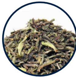
Nr. 233 Flugtee Darjeeling Soom Bio

«Eine meiner absoluten Liebessorten. Schwarzer Tee mit frühlingshafter Zitrusnote.» (Bewertung vom 23.03.16)