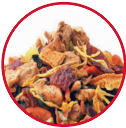
Nr. 1426 Maus Entdecker-Tee

«So einen leckeren Tee haben wir noch nie getrunken! Echt super!» Kunden-Bewertung