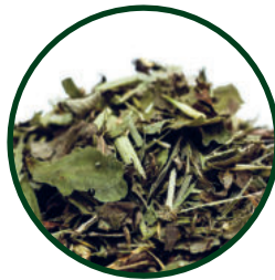
Nr. 1163 Österreichischer Bergkräutertee

«Sehr lecker, ob kalt oder heiß ein Genuss.» Kunden-Bewertung