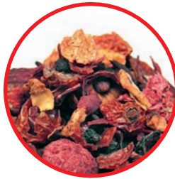
Nr. 1444 Heiß & Innig

«Naturstoffwechsel ist ein erfrischend herber Grüntee mit belebender Schärfe und anregender Zitrusnote. Ausgewählte Zutaten, wie Chili, Pfeffer und Ingwer stimulieren den Stoffwechsel und treiben ihn an. Gemeinsam mit dem Superfood Matcha können wir mit Naturstoffwechsel die Funktionen des Körpers optimal auf einem hohen Niveau halten.» (Bewertung von Prof. Dr. Froböse)