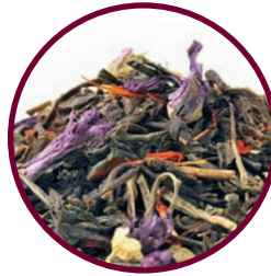
Nr. 933 Veronikas Grüne Ostern

«Ideal bei einer Diät.» (Bewertung vom 01.06.16)