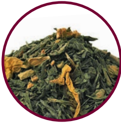
Nr. 1105 Naturstoffwechsel (Naturverliebt-Sortiment)

«Naturstoffwechsel ist ein erfrischend herber Grüntee mit belebender Schärfe und anregender Zitrusnote. Ausgewählte Zutaten, wie Chili, Pfeffer und Ingwer stimulieren den Stoffwechsel und treiben ihn an. Gemeinsam mit dem Superfood Matcha können wir mit Naturstoffwechsel die Funktionen des Körpers optimal auf einem hohen Niveau halten.» (Bewertung von Prof. Dr. Froböse)